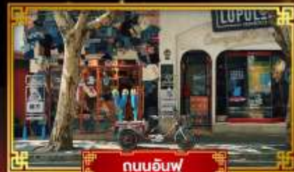
ถนนอันฟู่